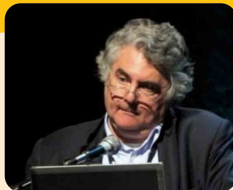
IL "PREMIO GALILEI" AI PROFESSORI ECK E DOSI