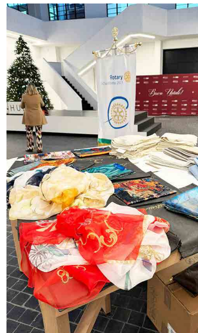
A sinistra, un bambino riceve la dose di vaccino antipolio in Africa. Nelle altre foto, materiali donati dalle aziende a favore della popolazione alluvionata alla presenza del sindaco di Prato e di altre autorità