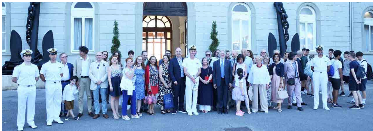
In alto, i giovani alla Terrazza Mascagni di Livorno Sopra, la visita all'Accademia Navale di Livorno con il Governatore Pietro Belli