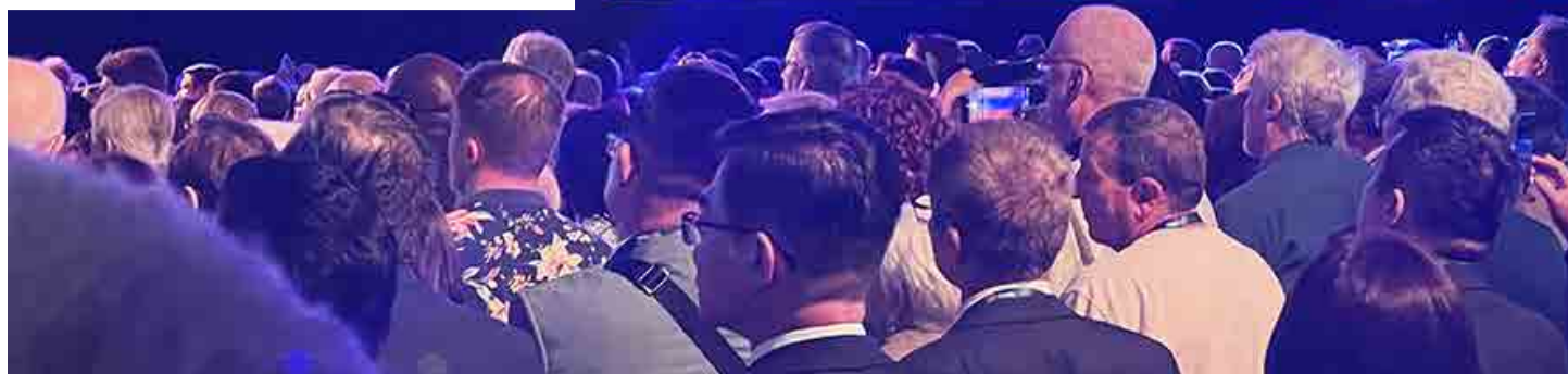
Sopra, un volontario Rotary vaccina un bambino: quello dell'eradicazione della Polio dal mondo è uno dei principali programmi della nostra Associazione. Nelle altre due foto, immagini della Convention di Singapore