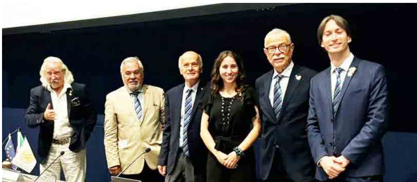
I relatori del Seminario sulla Comunicazione di Firenze