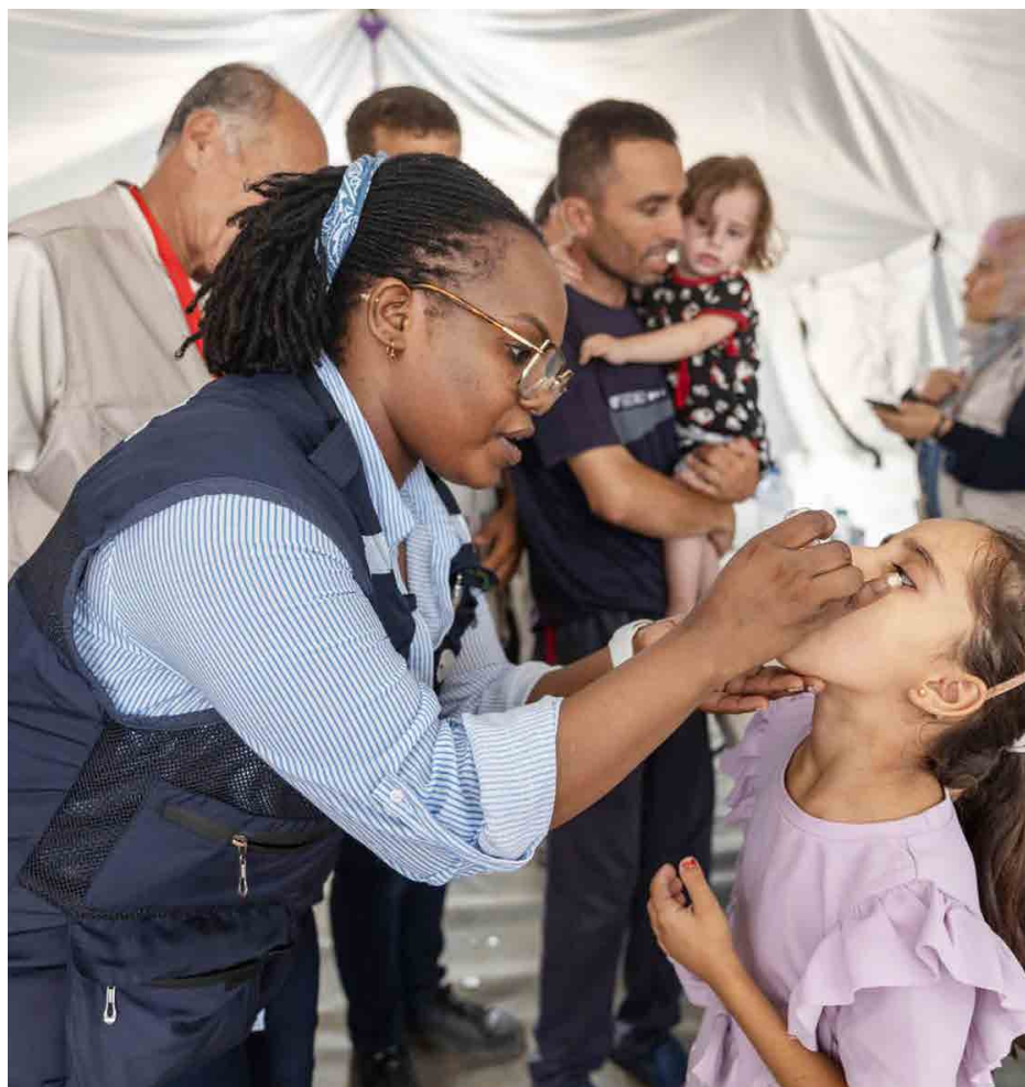
Vaccinazioni di bambini in corso nella striscia di Gaza

Senza le pause umanitarie, la realizzazione della campagna non sarà possibile” - sottolinea il comunicato reso noto dall'Oms a Ginevra - Il poliovirus è stato rilevato lo scorso luglio in campioni ambientali di Khan Younis e Deir al-Balah. In modo preoccupante, da allora sono stati segnalati nella Striscia di Gaza tre bambini che presentavano una sospetta paralisi flaccida acuta, un sintomo comune della poliomielite. “La Striscia di Gaza è libera dalla poliomielite da 25 anni. La sua ricomparsa rappresenta un'ulteriore minaccia per i bambini della Striscia di Gaza e dei paesi limitrofi”.