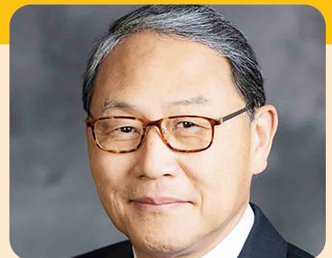
SANGKOO YUN PRESIDENTE INTERNAZIONALE 2026-27