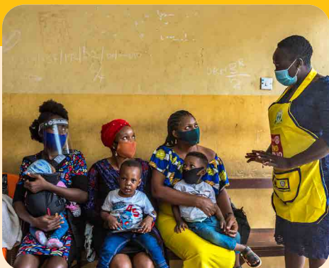
NASCE LA FONDAZIONE "ROTARY ITALIA"