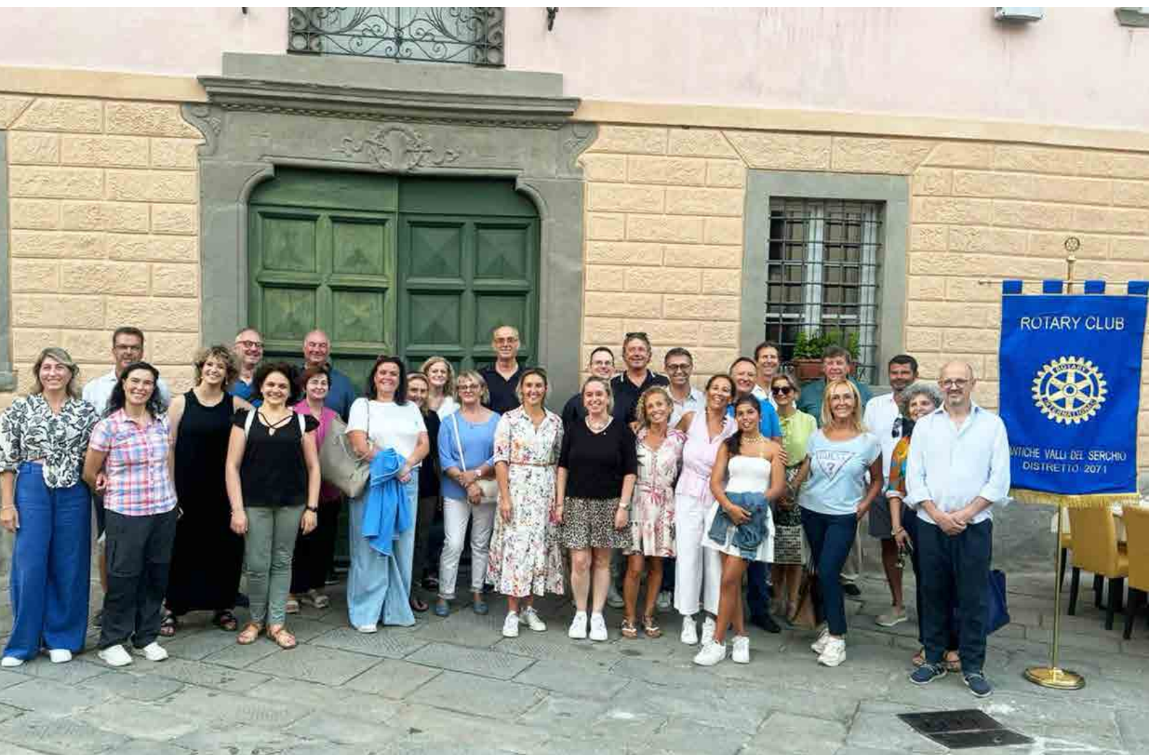
I partecipanti al momento culturale